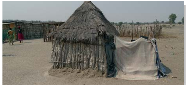
Geen water, geen sanitaire voorzieningen en weinig voedsel. Alleen droogte.

Schoon leidingwater, voldoende eten en goede sanitaire voorzieningen zijn voor ons vanzelfsprekend.