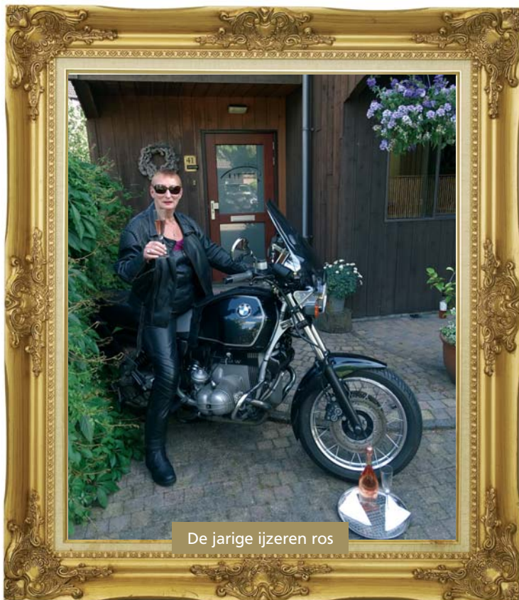
De jarige ijzeren ros

Jarig - En dan is ook mijn trouwe ijzeren ros jarig. Al vanaf dat zij het levenslicht zag, heeft ze mij veilig door heel Europa geloosd.